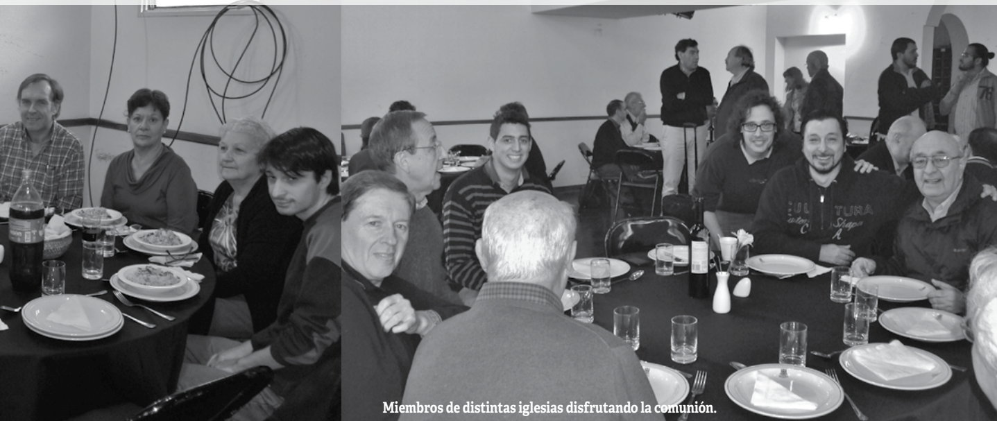
Miembros de distintas iglesias disfrutando la comunión.

han aprobado sus exámenes de ordenación y están avanzando hacia el pastorado.