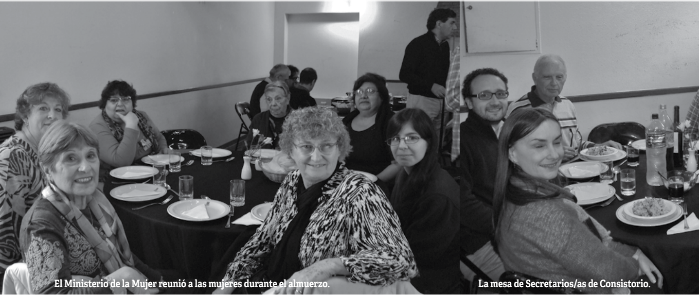
El Ministerio de la Mujer reunió a las mujeres durante el almuerzo.